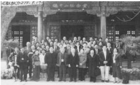
學者團與觀察團至孫中山先生紀念堂謁靈並合影，有追思、有歡喜、有期許，感懷萬千。《教訊》275. p.17

天極行宮因有中山真人(國父)和中正真人(蔣公)坐鎮，為持續完成未竟之大業，在我看來也是他們的「國防部指揮所」。這只要看看入口兩支撐天大柱，鐫刻著涵靜老人雄渾的墨寶：「願我玄穹，佑三民主義統一中國」、「念茲末劫，行宇宙真道重光地球」，這是天帝教的使命，也是二公(中山、中正)的使命，余以為也是這一代中國人的天命。