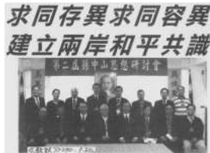
與會學者和同奮大合照，前排右四為維生先生。